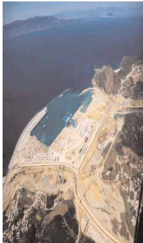
Tanger Med - Veduta aerea dell'area dei lavori