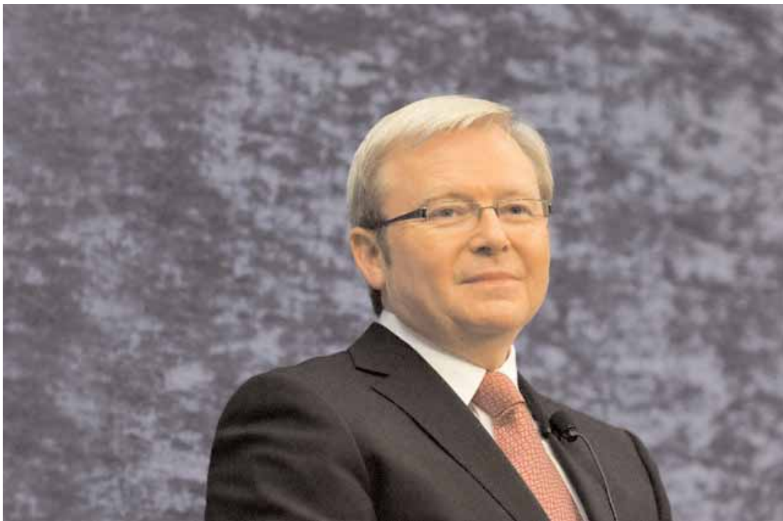
Un ritratto ufficiale del premier australiano, Kevin Rudd

fatti, è una delle poche banche centrali che non è ricorsa al cosiddetto quantitative easing, cioè alla stampa di moneta, per fare fronte alle difficoltà della crisi. E le principali quattro banche del Paese ( Commonwealth Bank, National Australia Bank, ANZ e Westpac ) continuano a mantenere un rating AA. In cambio, il Premier Kevin Rudd ha confermato l'impegno a realizzare il Programma di stimolo fiscale e di investimenti infrastrutturali, annunciati nell'ultimo bilancio federale. È un pacchetto consistente che, sommando le varie manovre straordinarie adottate a partire dallo scorso ottobre, prevede un ammontare complessivo di spesa che supera i 70 miliardi di dollari australiani (ca.40miliardi di euro). ▶▶