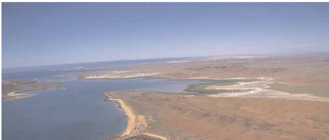
Karratha - La costa nei dintorni di Claverville, a una trentina di Km dalla città