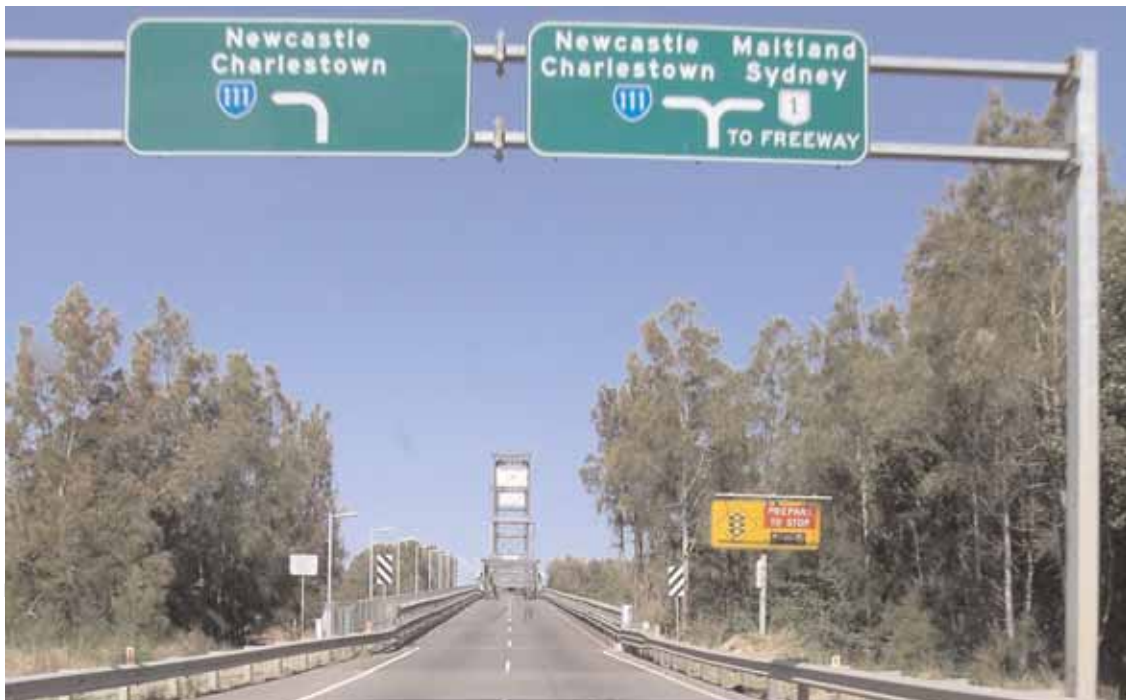
Pacific Highway - L'Hunter River Bridge