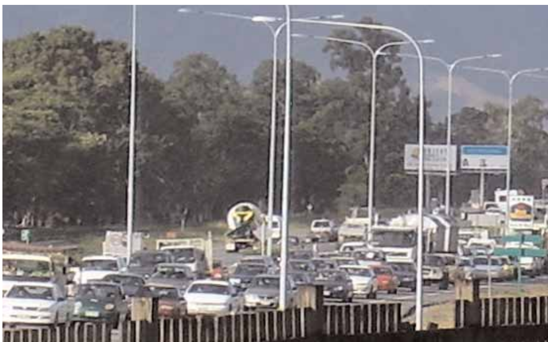
Cairns - La Bruce Highway nell'ora di punta