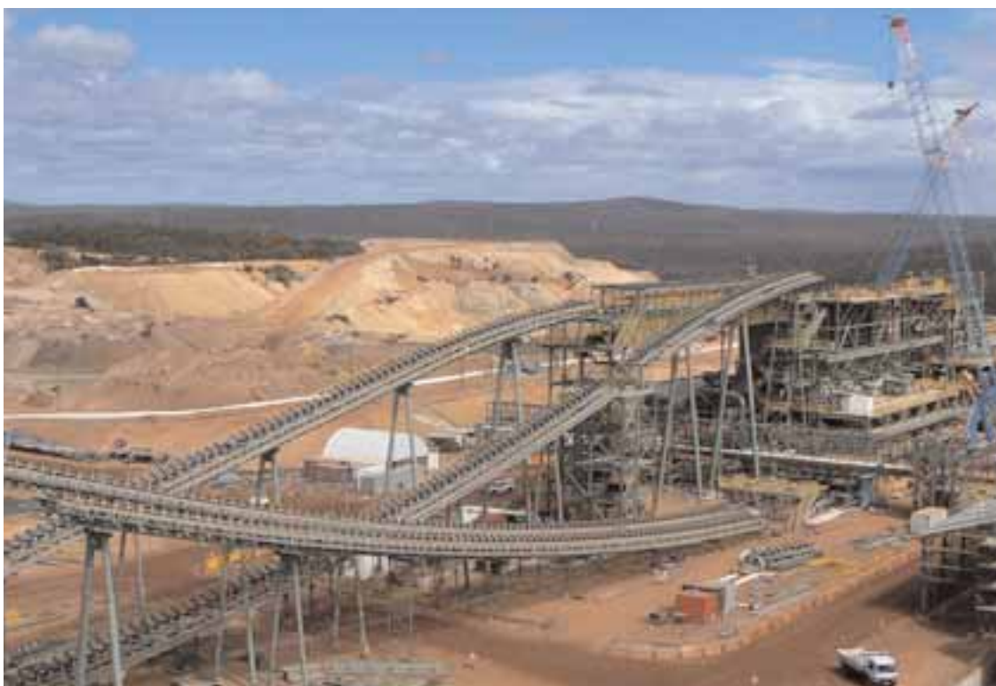
Boddington - L'omonima miniera d'oro è una delle più grandi a cielo aperto d'Australia

A fine luglio è programmata una missione del Sottosegretario agli Affari Esteri, Stefania Craxi . Dovrebbe essere seguita da una serie di missioni imprenditoriali da realizzare nella seconda metà del 2009 con focus specifico sui settori delle infrastrutture, gestione delle risorse idriche, fonti rinnovabili e alternative. ■