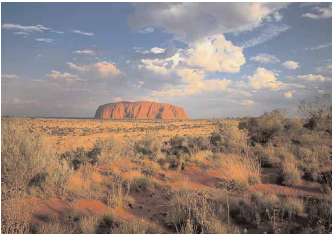
Ayers Rock - Il monolite è uno dei luoghi-simbolo del Quinto Continente

Inoltre, circa 70 nuovi progetti, per un valore complessivo di 80 miliardi di Aud, sono in uno stadio di sviluppo avanzato. In notevole incremento è l'estrazione di ferro, carbone e uranio (risorsa di cui l'Australia detiene il 40% dei giacimenti mondiali). Nonostante gli effetti della crisi finanziaria ed economica internazionale, si prevede che l'anno finanziario 2009-10 sarà per l'Australia il secondo anno record, dopo il 2008-09, per quanto riguarda gli introiti dal commercio delle commodities ed il primo per quanto riguarda i volumi esportati. Non vanno però dimenticate le potenzialità di investimento esistenti anche nel settore energetico, soprattutto tramite la partecipazione a joint venture o investimenti in equity. Settori importanti sia per l'interscambio che per l'avvio di collaborazioni industriali sono anche la meccanica strumentale, la farmaceutica, l'aeronautica, la cantieristica, le bio-tecnologie. Anche nei beni di consumo le opportunità non mancano, come dimostrano le "success stories" degli investimenti »