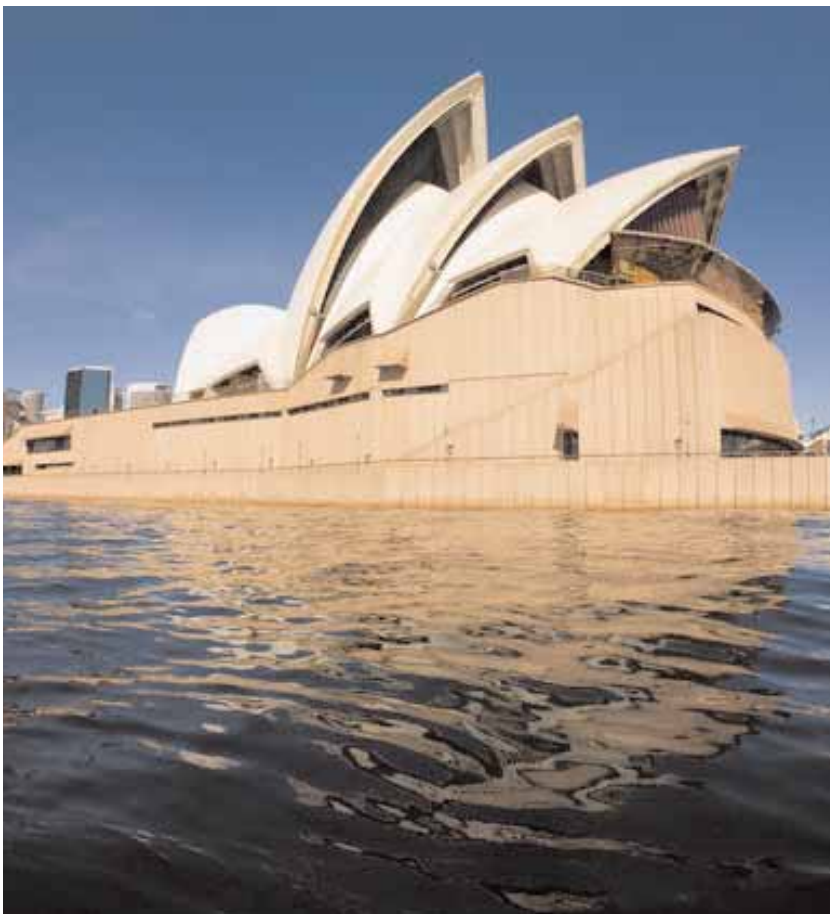
Sydney - L'inconfondibile architettura dell'Opera House