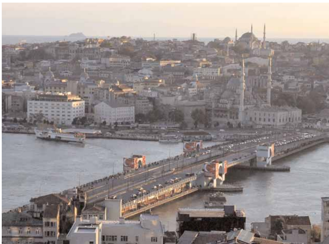
Istanbul - L'attuale Galata Bridge sul Corno d'Oro