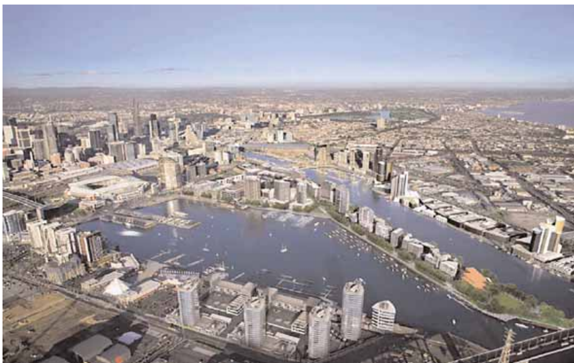
Melbourne - Veduta aerea, in primo piano il porto